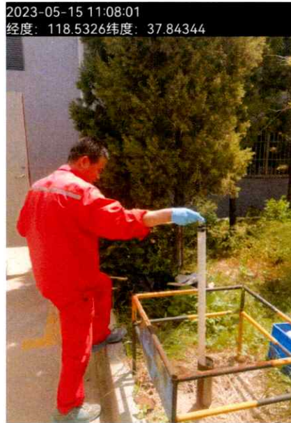
图 1 采样照片