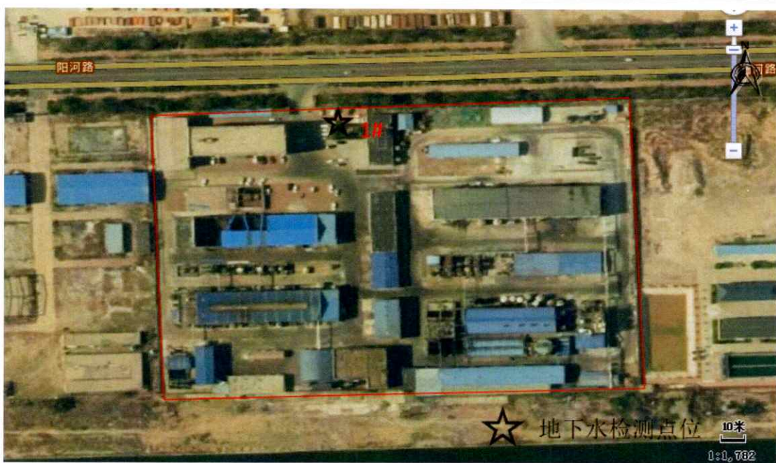
图 1 地下水检测点位示意图